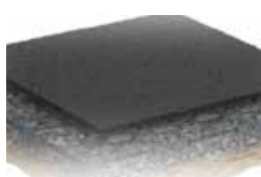
Formulação de compósitos de borracha reciclada e espuma de poliuretano