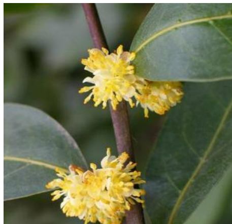
Loureiro ( Laurus nobilis )