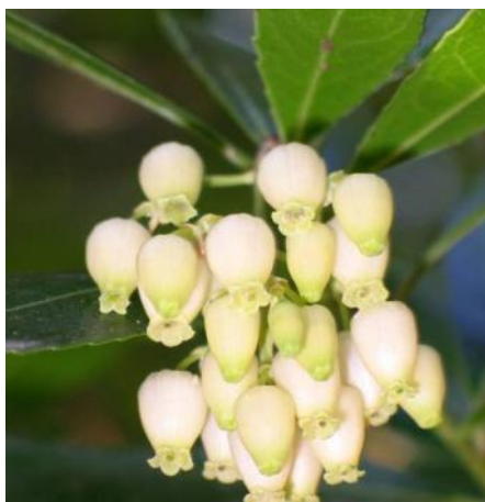
Medronheiro ( Arbutus unedo )