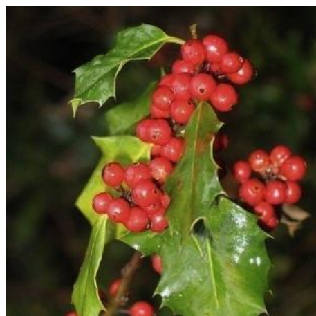
Azevinho ( Ilex aquifolium )