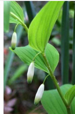
Selo-de-Salomão ( Polygonatum odoratum )