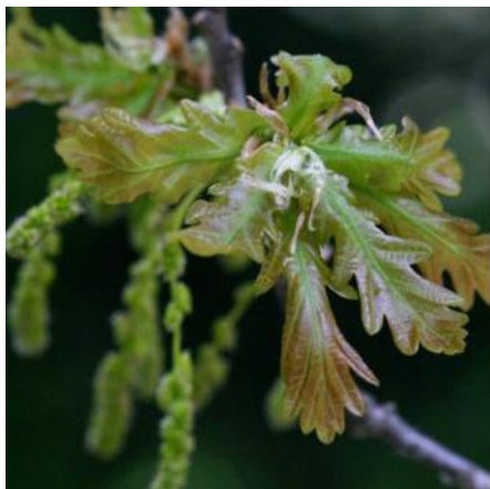
Carvalho-alvarinho ( Quercus robur )