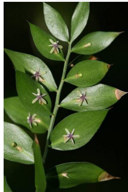
Gilbardeira ( Ruscus aculeatus )