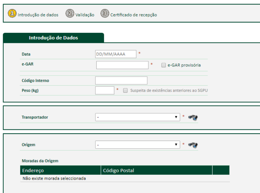
Figura 1. Registo de Receção com e-GAR

O transporte de pneus usados realizado pelo produtor e quando estes não resultem do exercício de uma atividade económica está isento da obrigação de preenchimento de e-GAR (alínea f do n.º2 do art.6º da Portaria 145/2017 alterada pelo art. 2º da Portaria 28/2019), e para dar resposta a esta particularidade encontra-se no SGPU On-line um módulo de registo e emissão de documento comprovativo da entrega de pneus usados – Guia de Receção Valorpneu, cuja diferença essencial face aos registos de receção já existentes é não ser necessário introduzir número de e-GAR (módulo “Receção de Carga sem e-GAR”). A Guia de Receção Valorpneu deve ser entregue ao detentor no momento da entrega dos pneus usados. Os procedimentos de caracterização aplicados a estes detentores são iguais aos seguidos para os restantes detentores de pneus usados, e são o fundamento para a classificação da entrega. Adicionalmente, o detentor particular deve preencher uma declaração (texto tipo disponível no SGPU Online ) de modo a informar a origem dos pneus. No âmbito do registo de receção devem carregar a ficha de caracterização e a declaração/e-mail digitalizadas.